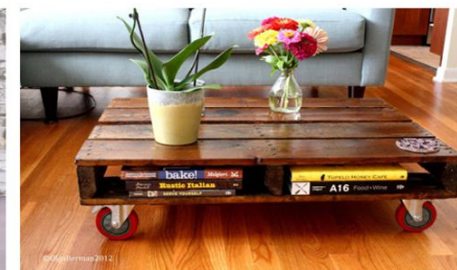
Riciclo e Riuso